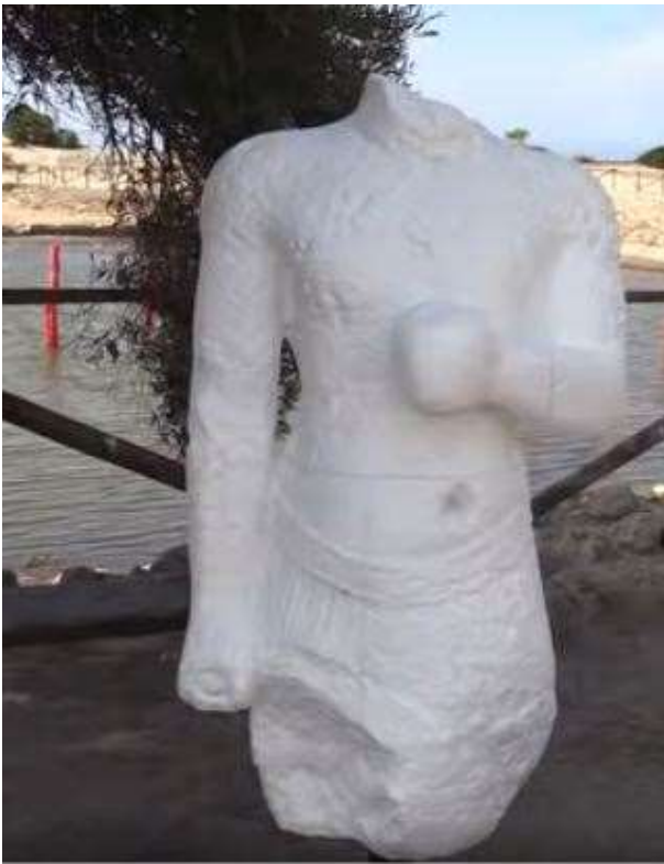
La statua dello Stagnone - Baal del Kothon

Federica Spagnoli è Professoressa Associata di Archeologia fenicio-punica e Archeologia del Mediterraneo presso l'Università di Roma Sapienza, Lettere e Filosofia, Istituto Italiano di Studi Orientali (ORCID https://orcid.org/0000-0003-0536-3321 ).