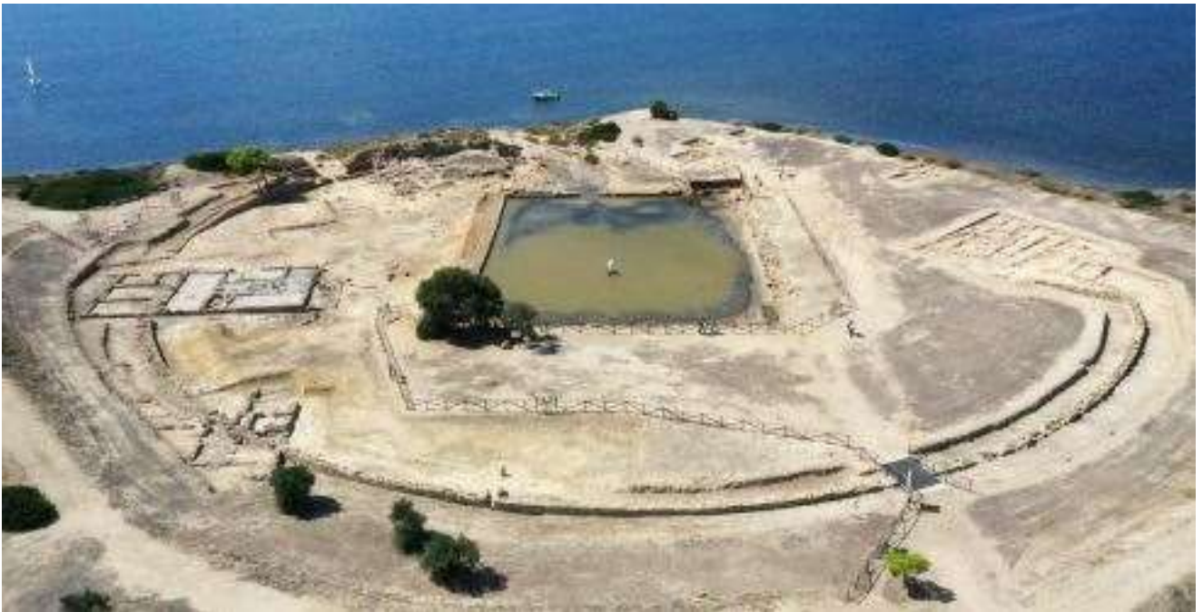
L'area Sacra del Kothon, da Nord. In primo piano il Temenos Circolare, a est il Tempio di Baal e il Tempio di Astarte, a Ovest il Santuario delle Acque Sacre