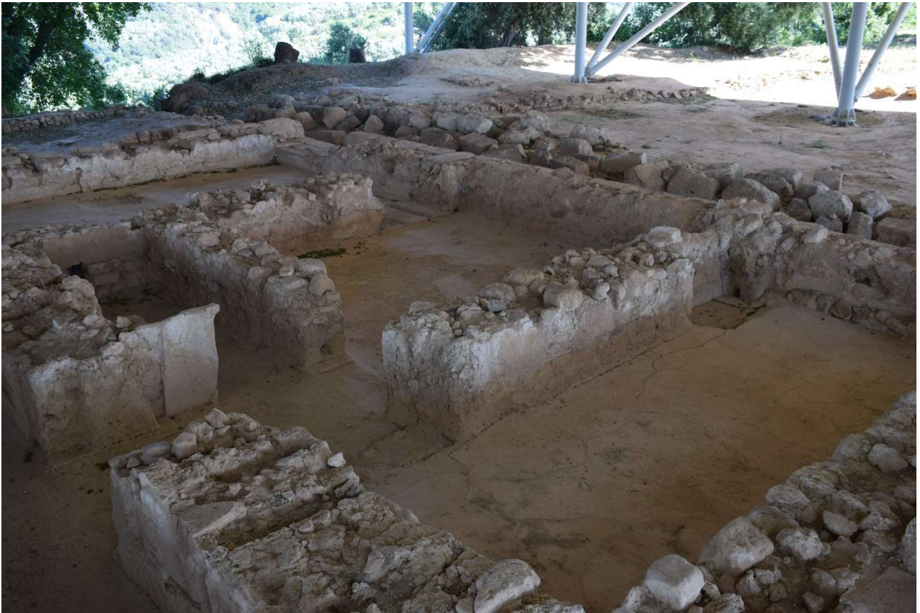
Palazzo di Nestore, Pilo circa 1330 a.C.