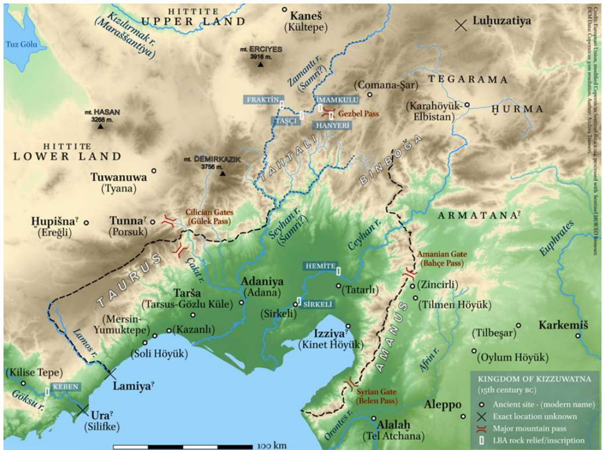
Kizzuwatna nel tardo XV secolo a.C.