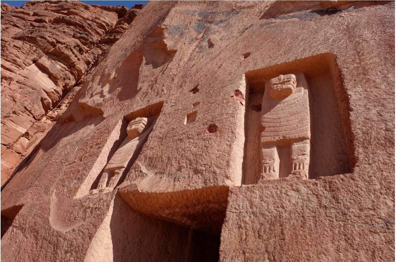
Iscrizione minea incisa fra i bassorilievi di due leoni sopra una tomba a Dadan