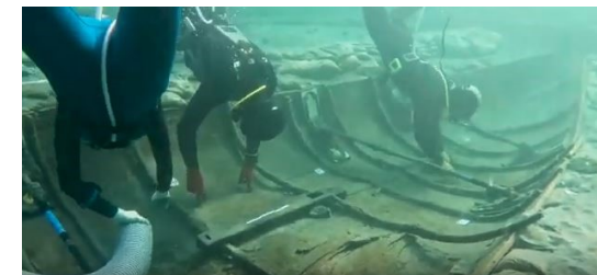
recupero del relitto di Marzarrón

5° incontro: sabato 29 marzo 2025 - inizio ore 15.00