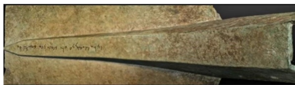
Il rostro punico di Egadi