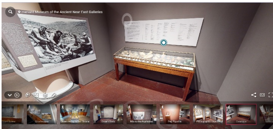
Harvard Museum of the Ancient Near East – Cambridge MA (tour virtuale)