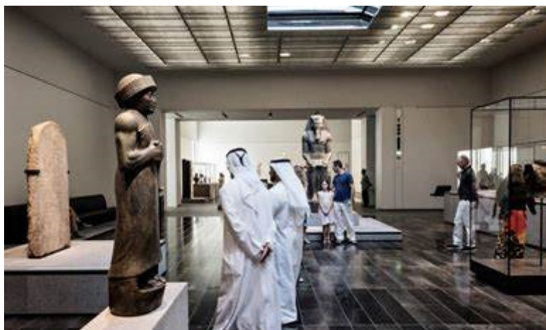
The Ancient Near East in the Louvre Abu Dhabi Museum (United Arab Emirates)