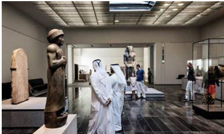
The Ancient Near East in the Louvre Abu Dhabi Museum (United Arab Emirates)

Negli ultimi anni i musei sono stati protagonisti di grandi trasformazioni attraverso l'innovazione digitale. Essi si trovano di fronte a una sfida molto importante: attrarre nuovi visitatori ma soprattutto comunicare il proprio patrimonio in forma diversa in modo da essere più vicino alle esigenze e alle aspettative di conoscenza dei cittadini e dei turisti. Questo processo che include l'adozione dei servizi digitali online per la fruizione delle collezioni (cataloghi open access, tours virtuali ecc.) e onsite (esposizioni interattive, sistemi di prossimità ecc.) ha anche riguardato le collezioni di antichità del Vicino Oriente antico presenti nei musei che grazie alle nuove tecnologie hanno incrementato o provano a incrementare il loro potenziale di attrattività ponendo il visitatore al centro di un'esperienza culturale di cui diventa protagonista.