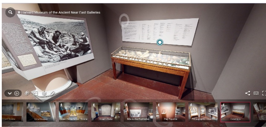
Harvard Museum of the Ancient Near East – Cambridge MA (tour virtuale)