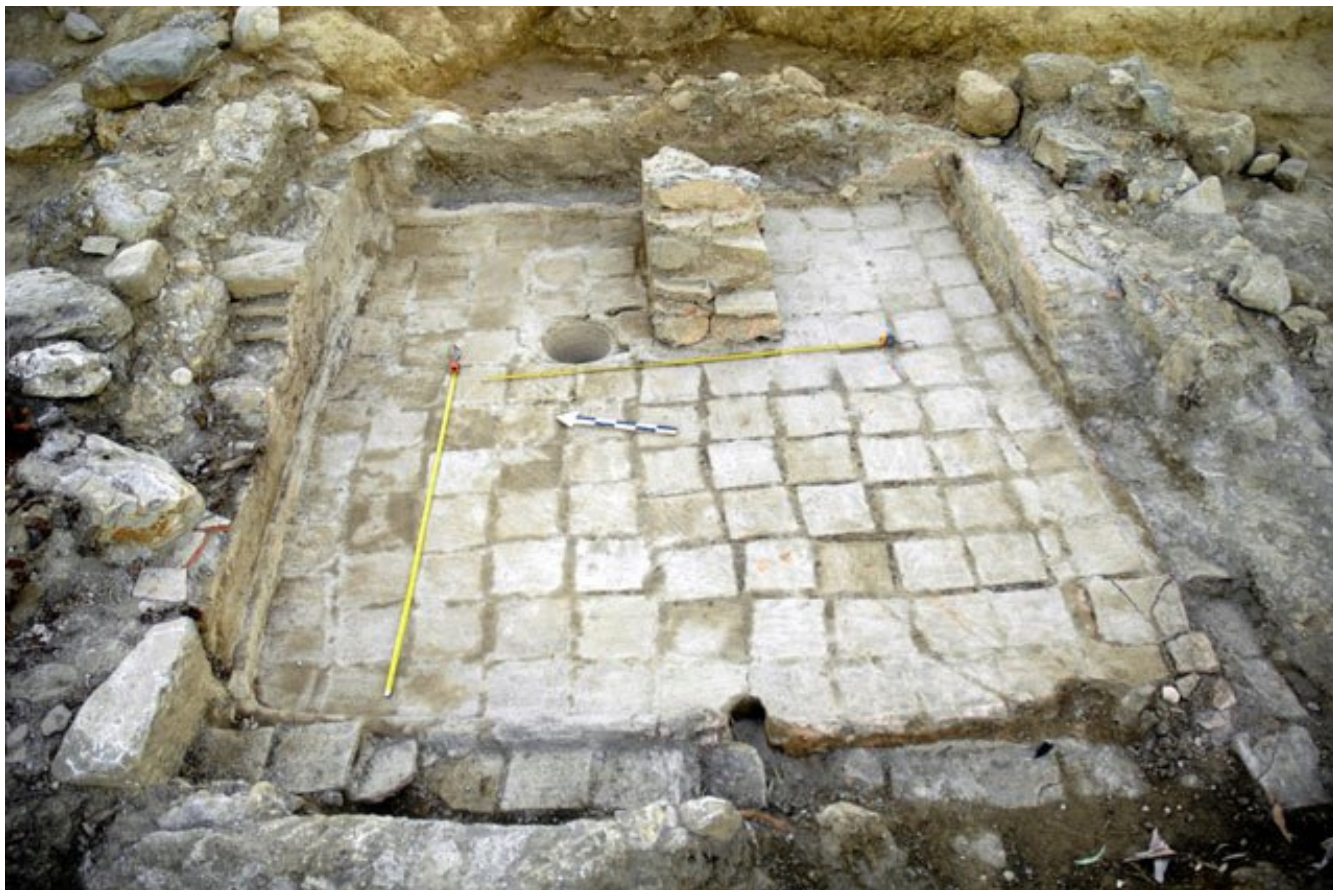
Palazzo miceneo scoperto a Sparta (Laconia), sulla collina di Aghios Vassilios