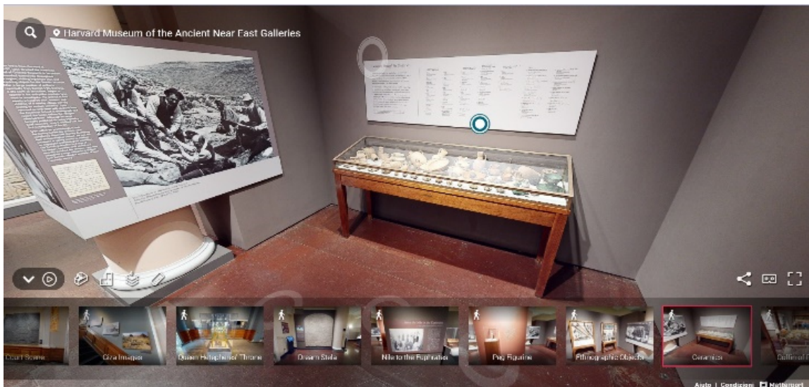
Harvard Museum of the Ancient Near East – Cambridge MA (tour virtuale)