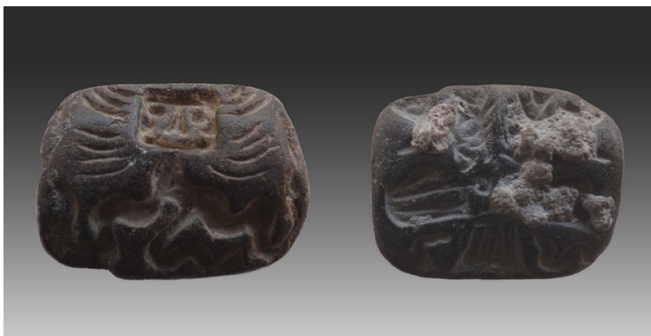
Sigillo a stampo in clorite raffigurante su un lato una creatura dal volto umano e dal corpo serpentiforme; sull'altro una figura femminile alata circondata da serpenti. Togolok 1, Bronzo tardo (1950-1500 a.C.)

Il progetto vanta la collaborazione di numerose istituzioni italiane ed internazionali, tra cui ricordiamo il German Archaeological Institute (DAI) e l'Università Libera (FU) di Berlino, l'Università di Berna, il Max Planck Institute for the Science of Human History di Jena (MPI-SHH), l'Università del Salento ed altri.