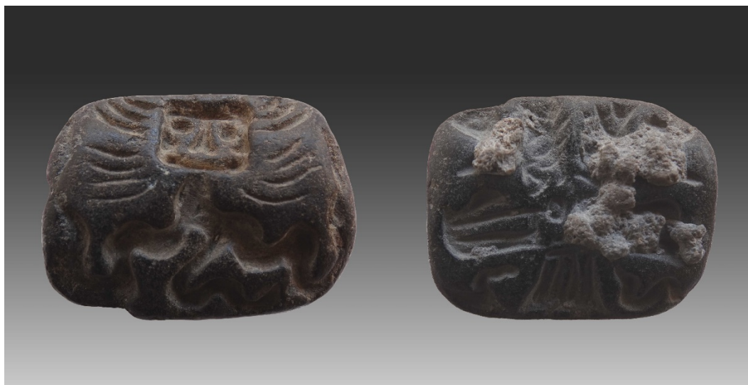
Sigillo a stampo in clorite. Togolok 1 (Turkmenistan meridionale), Bronzo tardo (1500-1000 a.C.)