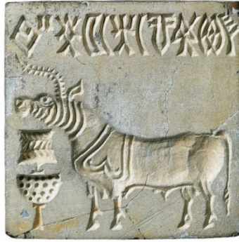
Sigillo a stampo della Civiltà dell'Indo con iscrizione in caratteri Harappani e bovide unicorno