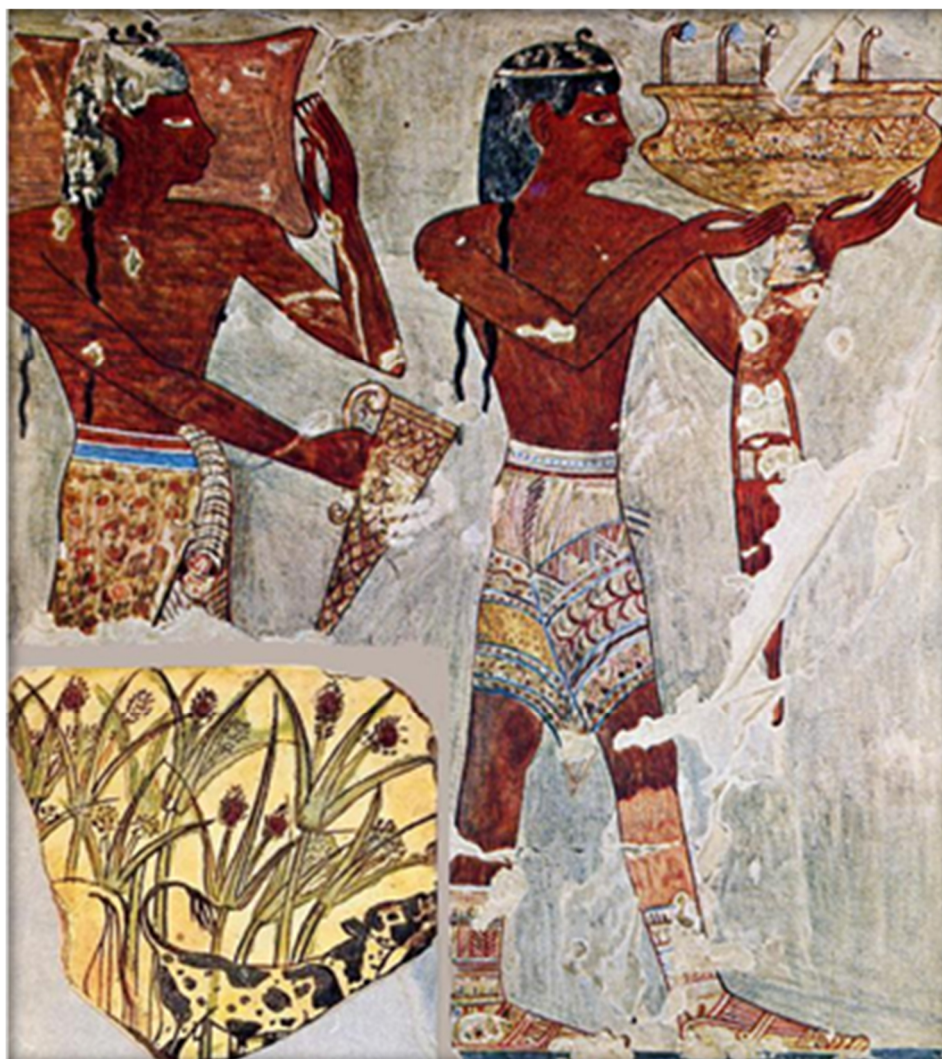
Egei portano doni a Rekhmira alto funzionario del grande faraone Thutmosi III (XVIII dinastia)