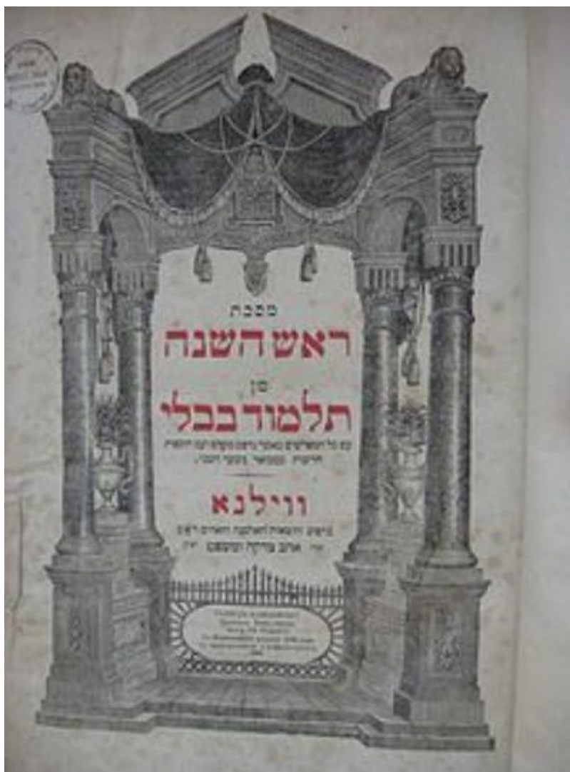
Pagina del Talmud Babilonese