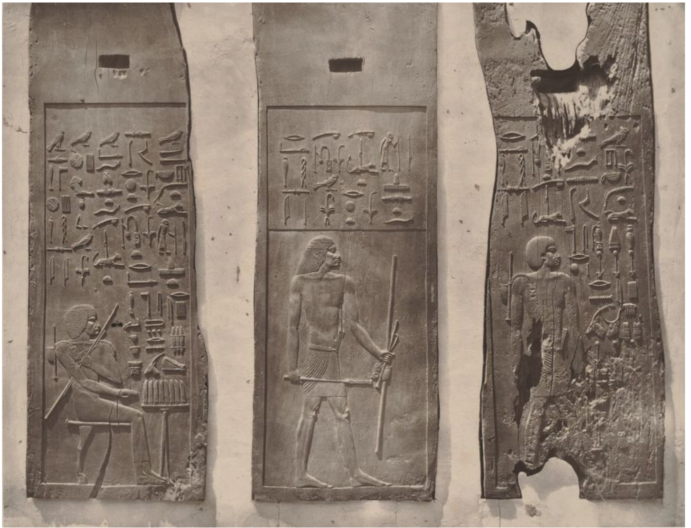
Pannello ligneo dalla tomba di Hesyra, capo dei medici e scriba del faraone Netjerykhet (Djoser) III dinastia.