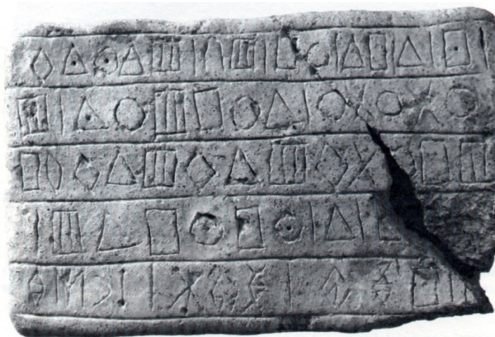
Tavoletta trovata a Konar Sandal Sud: iscrizione in caratteri geometrici, la riga più in basso è in Elamico Lineare