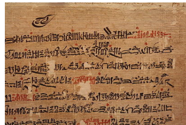
papiro ieratico Nuovo Regno (periodo ramesside)