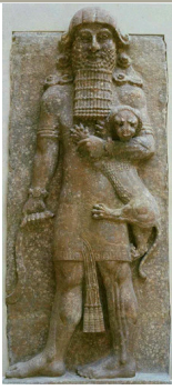
šā nagba imuru colui che tutto vede